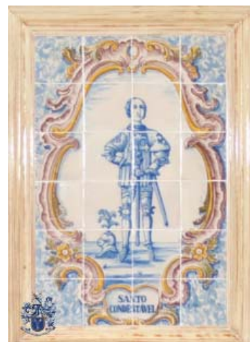
Capa: CAS Oeiras

IASFA Tel: 213194600 Fax: 213562595 relpub@iasfa.pt www.iasfa.pt